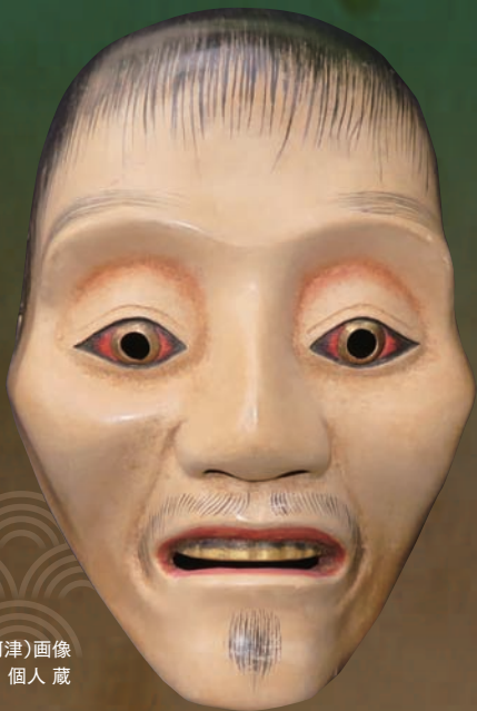
能面(河津)画像 個人蔵