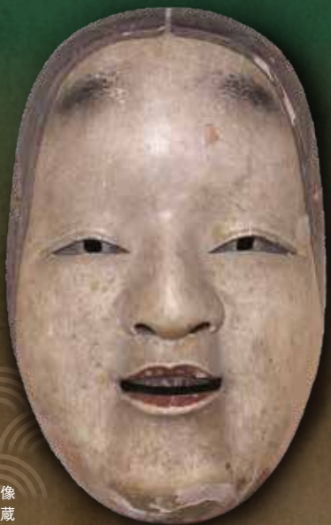
能面(小面)画像 宇佐神宮 蔵