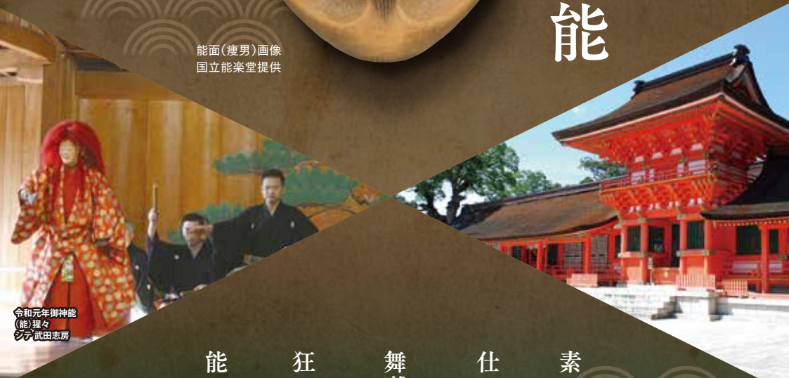
令和元年御神能 (能) 狸々 武田志房