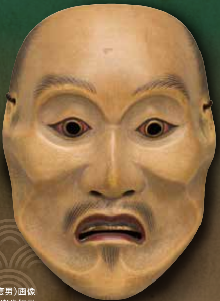
能面(瘦男)画像